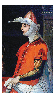
REGINA Cleopatra dipinta nel 1585 dalla pittrice Lavinia Fontana (Roma, Galleria Spada)

Il mondo romano, fin dall'epoca repubblicana, fu molto suggestionato dalle Storie di Erodoto, ma soprattutto il suo libro sull'Egitto costituì un modello carico di fascino. E lo stesso paesaggio egiziano, con i suoi templi, piramidi, obelischi, le sfingi e i leoni divenne motivo di ispirazione per la decorazione dell'Urbe. Il racconto del Nilo narrato da Erodoto con la lussureggiante vegetazione ai bordi del fiume, la stessa fauna selvatica di ippopotami e cocodrilli divennero dunque ispirazione per gli artisti; tanto che quando Silla ordinò ai mosaicisti alessandrini il grande pavimento musivo da collocare nell'aula absidata del Tempio della Fortuna Primigenia di Palestrina, il testo di Erodoto divenne un modello al punto che fu spesso adoperato anche come didascalia per spiegare il grandioso mosaico nilotico. Ma dopo che i Romani si spinsero oltre le piramidi nel Deserto orientale, quando Augusto conquistò militarmente l'Egitto, l'assimilazione divenne definitiva. Augusto, secondo Svetonio, portò a Roma come bottino di guerra migliaia di reperti: sfingi, co-